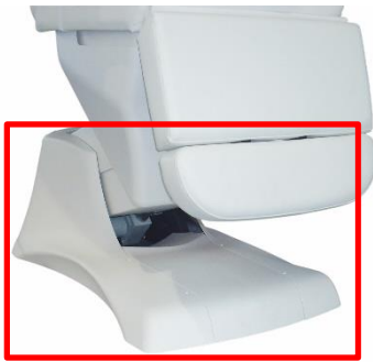
Abb. 9: Fertig montierte Verkleidung