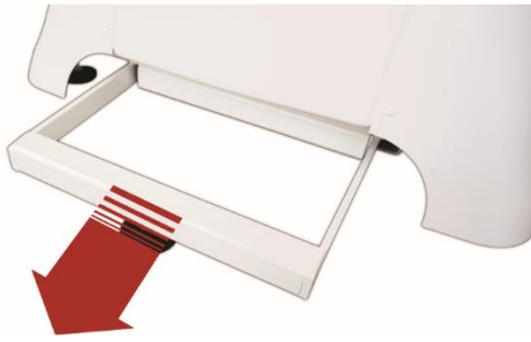
Abb. 10: Kippsicherung ist ausgefahren