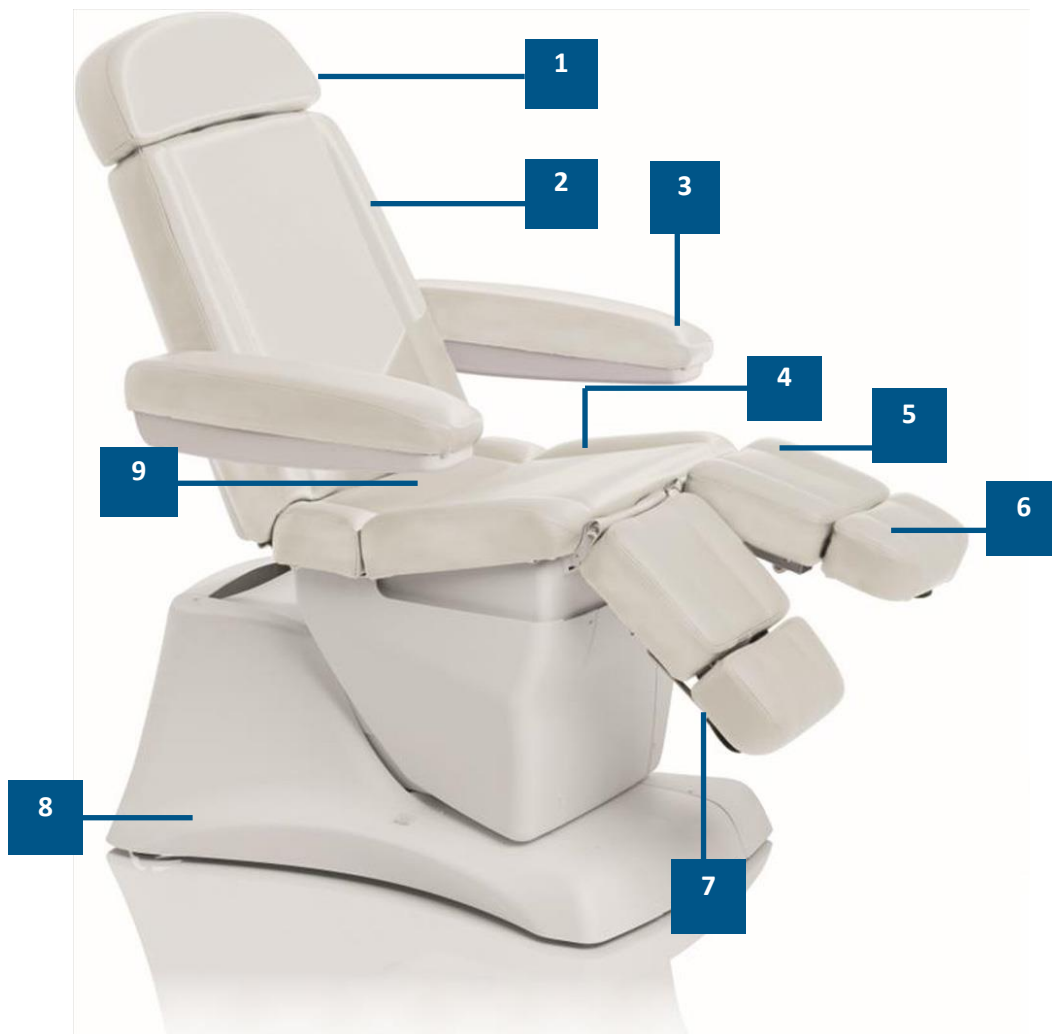
Abb. 1: SÜDA PODO XDREAM FUSSPFLEGESTUHL