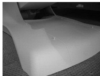
Abb. 6: Niethülse einstecken