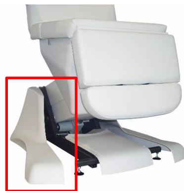
Abb. 4: Seitliche Verkleidung positionieren