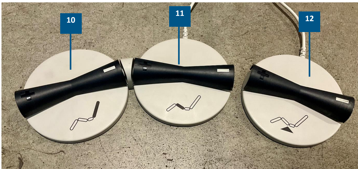
Abb. 2: Fußtaster