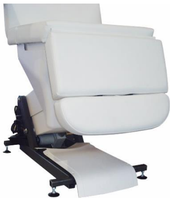
Abb. 3: Anlieferungszustand des Fußpflegestuhls