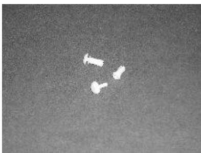
Abb. 5: Spreizniete